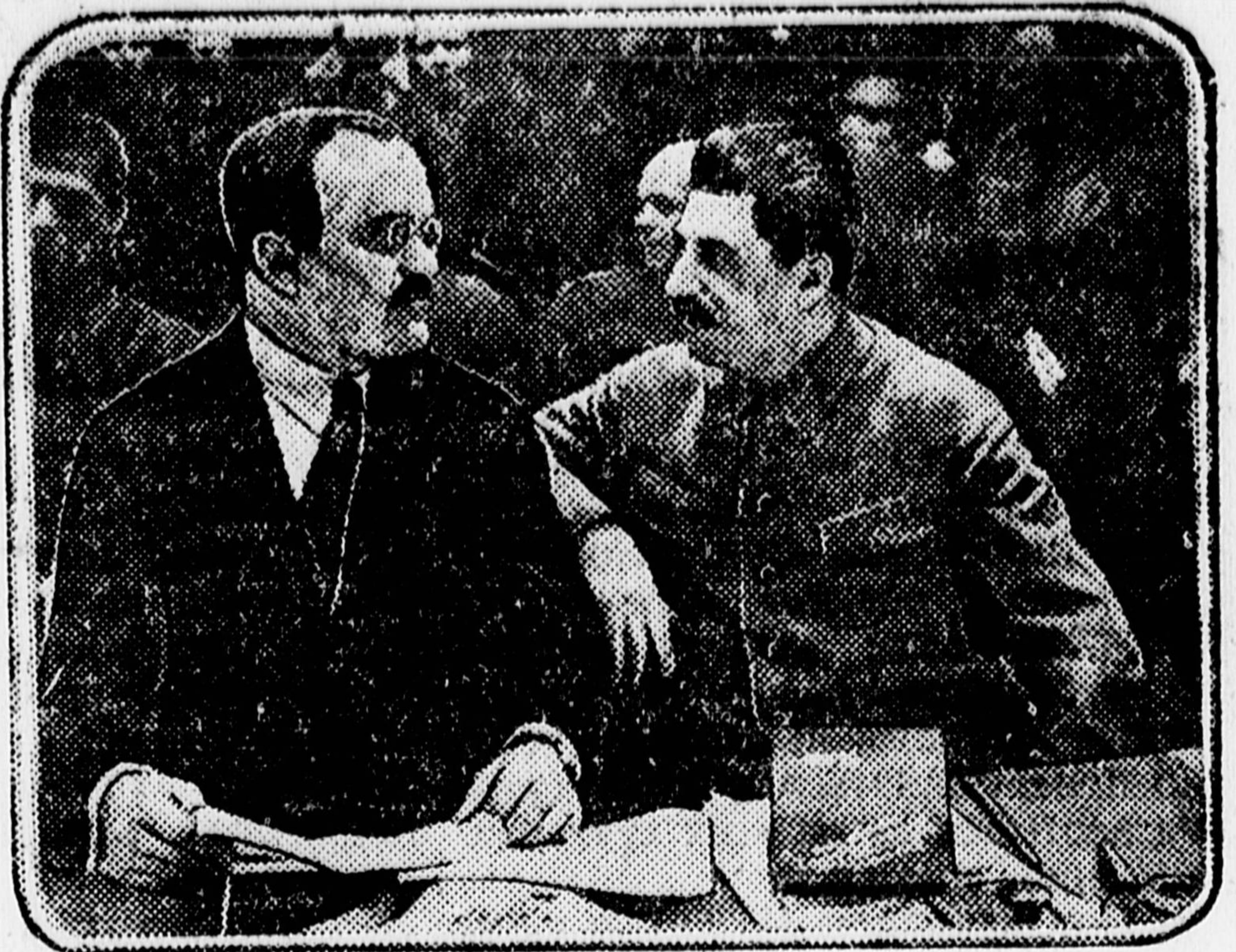
Тов. СТАЛИН и тов. МОЛОТОВ в президиуме с'езда.

★ 15 февраля в Большом театре открылся первый всесоюзный с'езд колхозников-ударников.