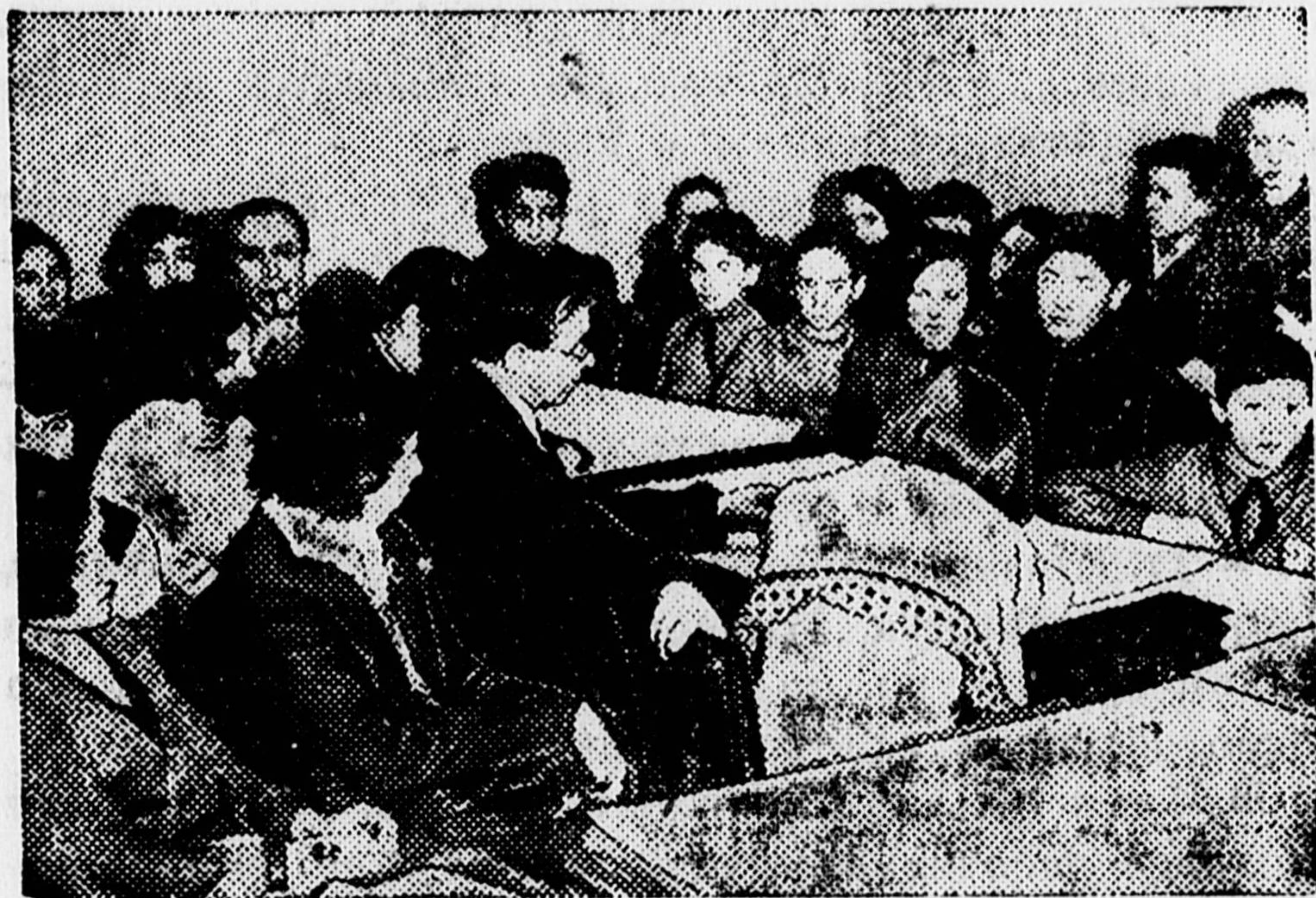
Встреча актеров Московского театра для детей с тубригадой «Пионерской правды» и детактивом театров. НА СНИМКЕ — обсуждение спектакля: «Крекинг».

Крепче связь детского театра со школой и отрядом!