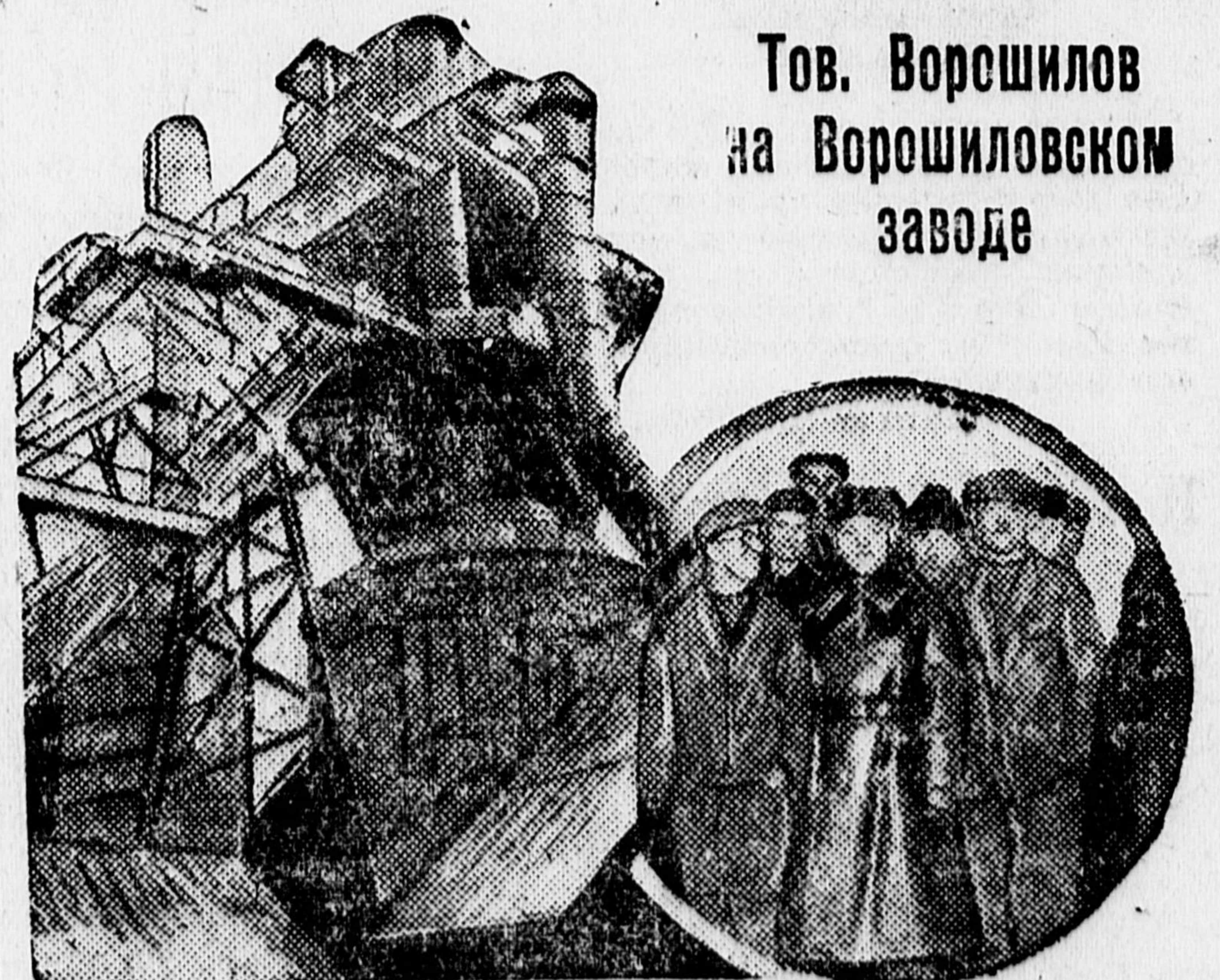
Тов. Ворошилов на Ворошиловском заводе

Алабамский суд назначил новое слушание дела семи негр-тяжких юношей на 6 марта в Скоттсборо.