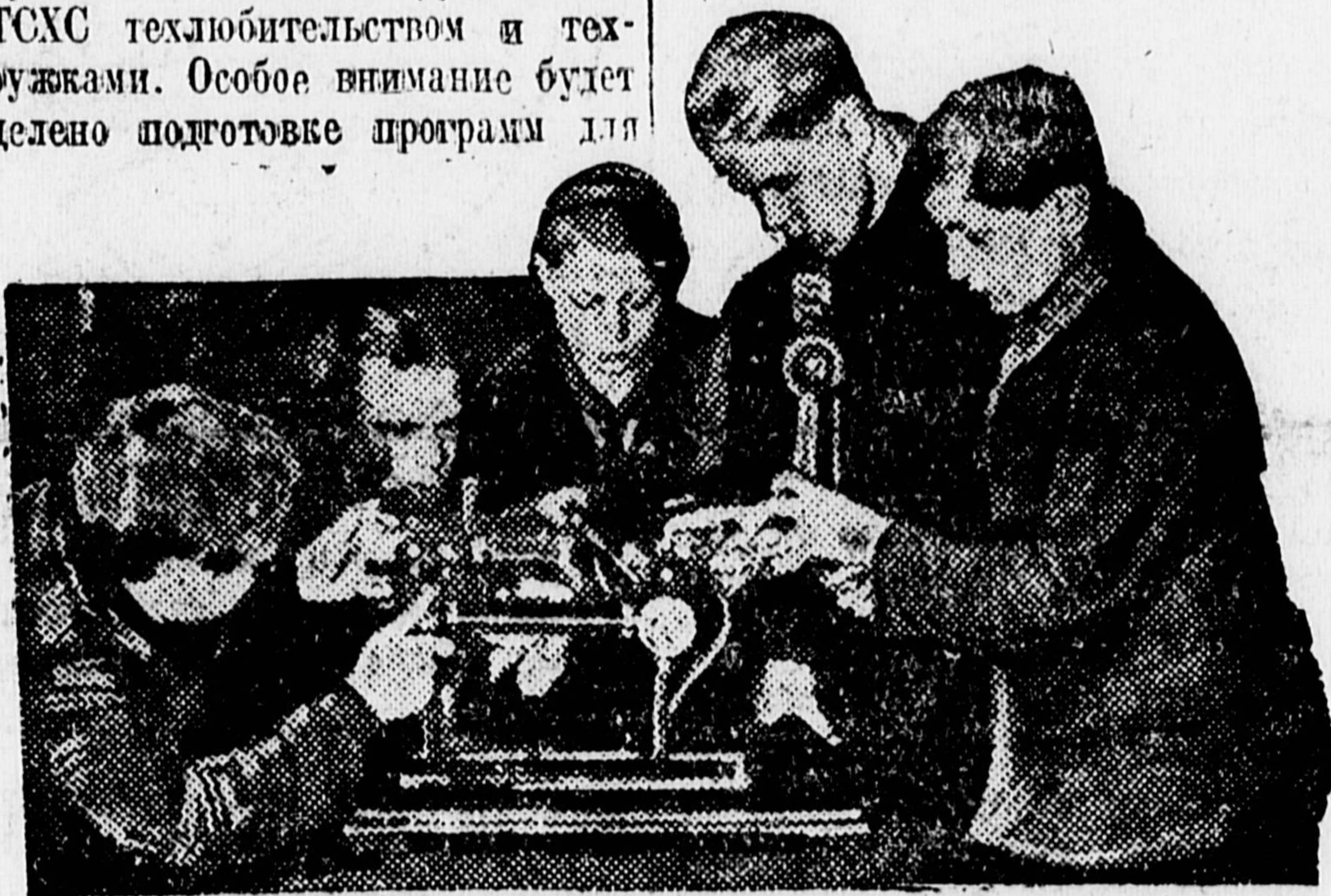
При ленинградском кино «Горн» организован детский кинотехнический кружок. НА СНИМКЕ — ребята за изучением киноаппарата.

На местах теперь же необходимо начать оживленную подготовку к совещанию. На бюро ДКО заслушать отчеты ДТС, организовать смотры работы кружков и руководств ДТС, проверить выполнение обязательств предприятий, профсоюзов и добровольных обществ по отношению к юным техникам, обобщить опыт участия специалистов в работе ДТС и кружков.